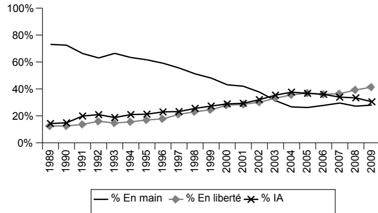
Evolution selon le type de monte